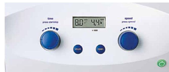
Дисплей центрифуги Centrifuge 5702