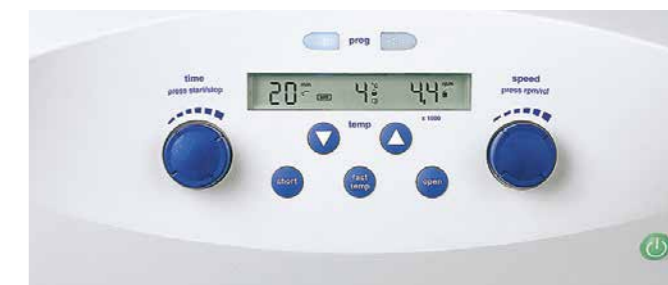
Дисплей центрифуги Centrifuge 5702 R и 5702 RH